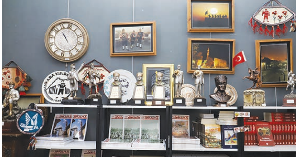
"ANKARA'NIN TANITIMINA KATKI SAĞLAYACAK"

Ankara Kulübü olarak yayınevi ve yapımcı kimliğimizle derlediğimiz kitaplar, dergiler, albümler, Ankara Kulübümüzün tarihsel sembollerini yansıtan ve Ankara'mızın ruhunu taşıyan yayınlar ile çok çeşitli objelerden oluşan el emeği göz nuru onlara hediyelek eşya ürünleri buradan ziyaretçilerimizin beğenisine sunulacak. Bizim attığımız bu adımlar inşallah gelecekte kartopu gibi büyüyecek." dedi.