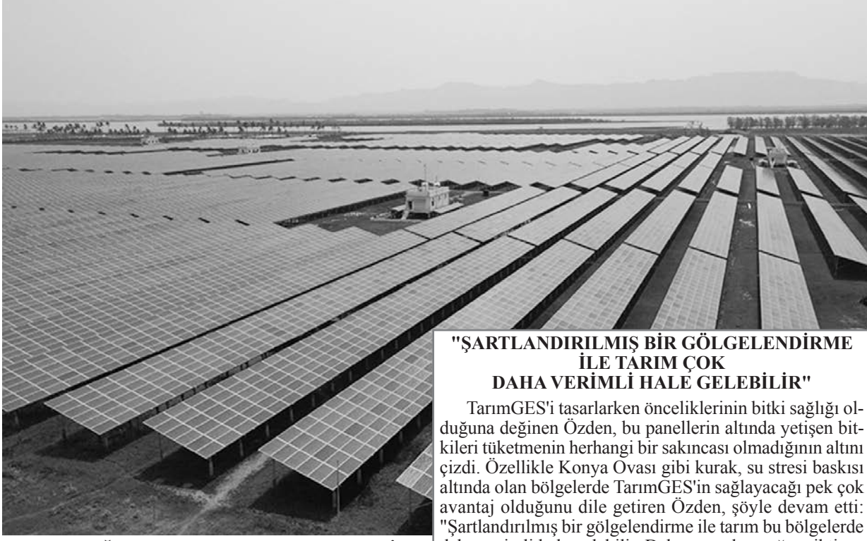
KAYISI AĞAÇLARININ VE DOMATESLERİN ÜZERİNDE GÜNEŞ PANELLERİ OLACAK