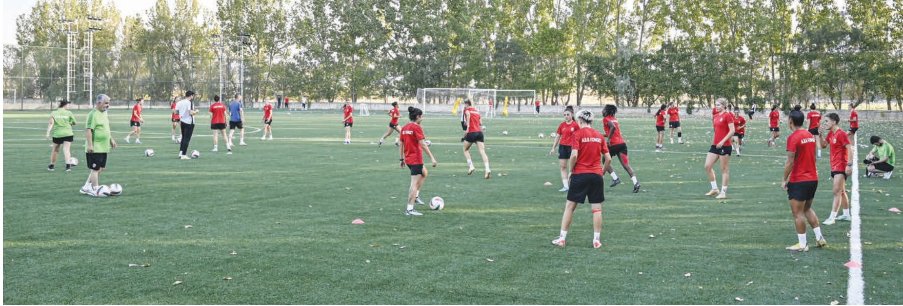
ABB FOMGET, sezona ikinci şampiyonluk parolasıyla başlayacak

projeler sunacağız. Eminim ki önümüzdeki sezonlarda bu takımlardan birkaç tanesini de hentbolun içerisinde göreceğiz." değerlendirmesinde bulundu. (DHA-AA)