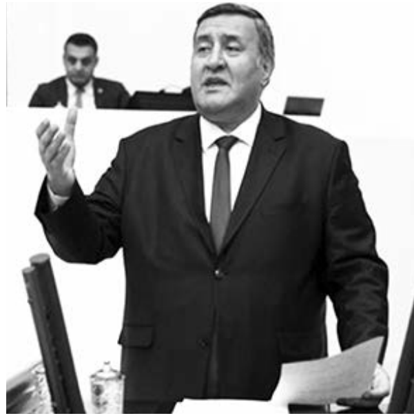
mine göre 64 milyar lira arttı. Bu verilerde kaygı verici" diye konuştu.

Gürer, "Bankalara ibraz edildiğinde karşılıksız çıkan çek sayısı ve bu çeklerin tutarında tam bir patlama yaşanıyor. Ticaret sektöründe borcunu ödeyememe eğiliminin önemli göstergelerinden biri olan karşılıksız çek sayısı bu yılın ocak-temmuz döneminde geçen yılın dönemine göre yüzde 80,5 oranında artarak 146 bin 334'e yükseldi. Karşılıksız kalan çeklerin parasal tutarı ise yüzde 247 oranında artarak 90 milyar lirayı buldu. Karşılıksız çeklerin parasal tutarı geçen yılın aynı döneme göre 64 milyar lira arttı. Bu verilerde kaygı verici" diye konuştu.