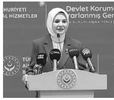
HURİYETİ KORUYAN ALI HİZMETLER Devlet Koruma Kurumlarında Yetişen Gençlerin Kamuda İstihdamını Sağladı

Bakan Göktaş, kuruluşlarda kalan 2 bin 112 çocuğun lisanslı sporcu olarak bakanlığa bağlı spor kulüplerinde yeteneklerini geliştirdiğini belirterek, "Aralarında 30'u milli sporcu olan çocuklarımız hem ulusal, hem de uluslararası müsabakalarda başarılarıyla ülkemizi temsil ediyor. Ayrıca her bir gençimize rehberlik ediyor, iş ve meslek danışmanlarımızla çalışma hayatına hazırlıyoruz. İŞKUR ile yürüttüğümüz eğitim çalışmalarına bugüne kadar 8 binden fazla çocuğumuzun kariyer planlamalarına destek olduk. Bugüne kadar 62 bin 838 gençimizin kamuda istihdamını sağladık. Bugün de, 2024 yılının ikinci dönem yerleştirmelerini gerçekleştiriyoruz. Bu süreçte gençlerimizin sadece kamuda değil, özel sektörde de istihdam edilebilmeleri için teşvik politikaları uygulamaya başladık. Özel sektörde çalışan gençlerimizin SGK primlerini karşılayarak iş gücüne katılmalarını kolaylaştırıyoruz. Bu kapsamda bugüne kadar 13 bin 906 özel sektör istihdam teşviki sağladık. Hayatlarının her anında çocuklarımızın yanında oluyor, mutluluklarını paylaşıyor, sevinçlerine ortak oluyoruz" ifadelerini kullandı. Bakan Göktaş'ın konuşmasının ardından noter huzurunda kura çekilip, devlet korumasından yararlanan 729 gencin ataması gerçekleştirildi. (DHA)