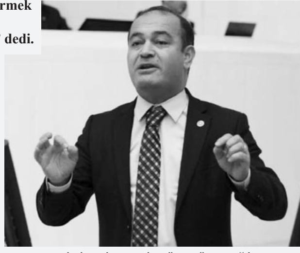
“KRİZİN BİTMESİ MÜMKÜN DEĞİL”

Peki, ülke ekonomisi nasıl çevriliyor? Öncelikle sayıları tam olarak bilinmemekle birlikte, 10 milyon civarında birisi. Üçüncü olarak da, vergiden kaçan işletmelerin sayısı da hızla artıyor. Bunların rantlarına göz yumuluyor. Enflasyonun da belirli kesimlere servet transferi yarattığını biliyoruz. Halkın büyük kısmı enflasyon nedeniyle derin yoksulluğa gömülürken, küçük bir kısım enflasyonu bahane ederek servetine servet katıyor. Ama bizim rasyonel zemin diyen bakışımızı ne yaptı? Gitti vatandaşın ödediği KDV'yi yüzde 18'den yüzde 20'ye çıkardı. Halka büyük yarımlar söylüyor. 2025 yılında her şeyin daha iyi olacağı belirtiliyor. Bu kafayla devam edildiği sürece Türkiye'nin toparlanması asla söz konusu değil.”