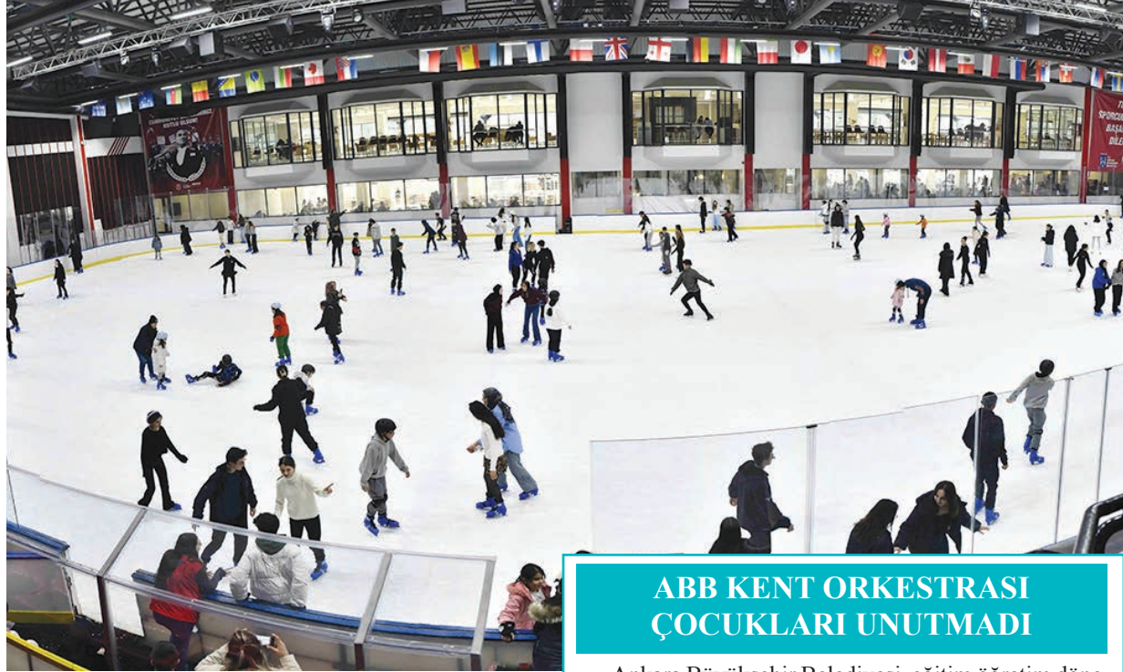
ABB KENT ORKESTRASI ÇOCUKLARI UNUTMADI

Ankara Büyükşehir Belediyesi tarafından Başkent kazandırılan dijital hayvanat bahçesi, yarıyıl tatilinde de