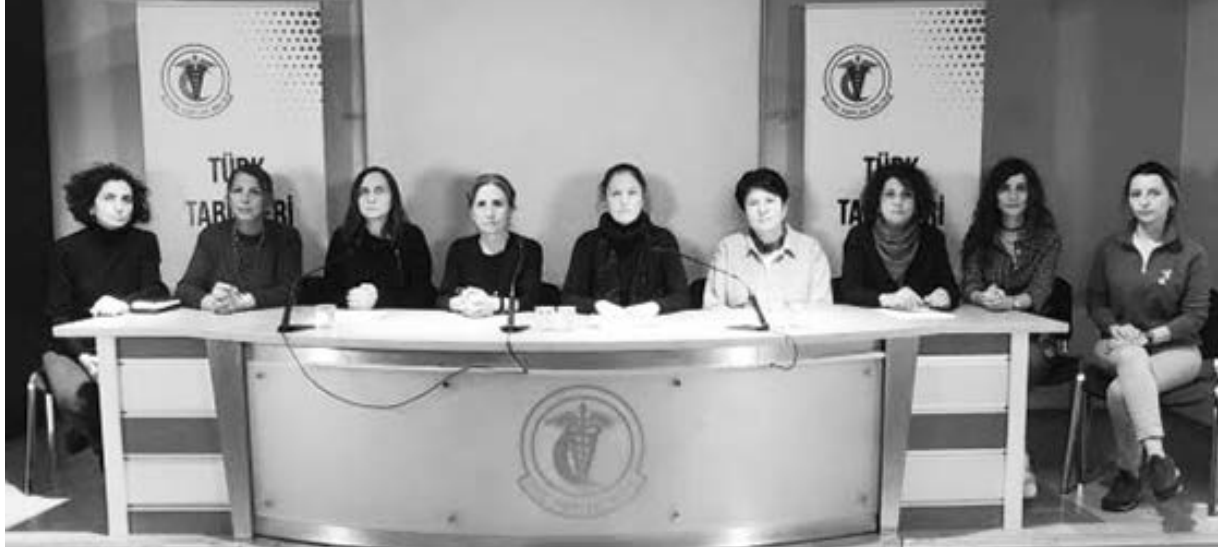
“TÜRKİYE 146 ÜLKE ARASINDA 127'NCİ SIRADA”

Kadının modernleşme sürecinde modern, çağdaş, milliyetçilik özneli ırk temelli üreme politikalarının aracına dönüştürüldüğünü, neoliberal dönemde ise buna makroekonomik hedeflere uygun üreme politikalarının eklenildiğini vurgulayan Gambetti sunumunu şu vurguyla noktaladı: “Türkiye’de yıllardır üç çocuk politikaları ile vizeye 2025’in Aile Yılı ilan edilmesi ile kadın bedeni üzerinde artan baskının amacını sadece muhafazakarlık veya kimlik siyaseti olarak değerlendirmenin yetersiz kaldığını düşünüyor; kadın bedeninin yönetimine makroekonomik hedefler üzerinden bakmanın da gerekliliğine dikkat çekiyorum.”