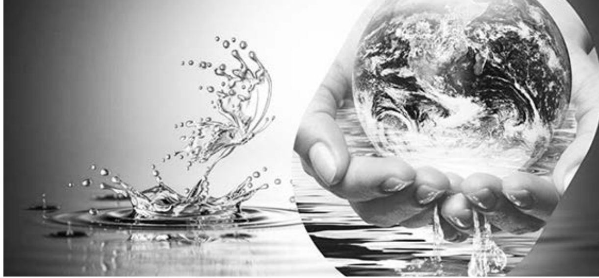
"İKLİM KRİZİ VE MÜCADELE"

Türkiye, coğrafi konumu itibarıyla buzul kaynaklı su sistemlerine doğrudan bağımlı olmasa da, küresel iklim krizinin etkilerinden olumsuz etkilenmektedir. Ülkemizde su kaynaklarının azalması, kuraklık ve tarımsal verim kaybı, buzulların erimesiyle tetiklenen küresel sorunların bir yansımasıdır." denildi. Açıklamada, son yüzyılda buzulların dramatik bir şekilde azaldığı belirtilerek, şöyle denildi: "Dünya genelinde buzulların hacmi son yüzyılda dramatik bir şekilde azalırken, bu durum deniz seviyesinin yükselmesine, tatlı su kaynaklarının tükenmesine ve tarım arazilerinin kaybına yol açmaktadır. Sürdürülebilir su yönetimi olmadan gıda güvenliği ve güvencesi sağlanamaz. Buzulların korunması, yalnızca bir çevre sorunu değil, aynı zamanda insanlığın gıdaya erişim hakkının sağlanması ve sürdürülmesi meselesidir. Ne yazık ki, ülkemizde su politikaları hâlâ kamu yararı yerine rant odaklı projelere öncelik verilerek yürütülmektedir. HES'ler, madencilik faaliyetleri ve plansız sanayileşme, su havzalarının hızla tahrip etmekte, ülkemiz su fakiri olma yolunda ilerlemektedir."