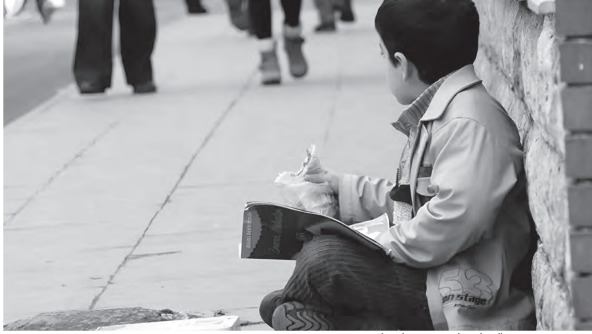
“İSTİSMAR RİSKİ YÜKSEK”

İnsanların doğal yapılarından (yani annelerinden, kar-