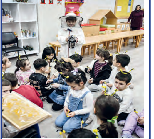
ABB Kırsal Hizmetler Daire Başkanlığı tarafından düzenlenen "Tarım Gönüllüsü Çocuklar Eğitim Programı" aracılığıyla Başkentli minikler, doğal yaşam döngüsü üzerine farkındalık kazandırdığı dolu dolu bir gün geçirdi. Kuşcağzı Çocuk Etkinlik Merkezi'nde gerçekleştirilen programda minikler; video gösterimleri, uygulamalı etkinlikler ve eğlenceli atölye çalışmalarıyla tarımın gücünü, kırsal kalkınmanın değerini ve üretimin önemini derinlemesine keşfetti. (Haber Merkezi)