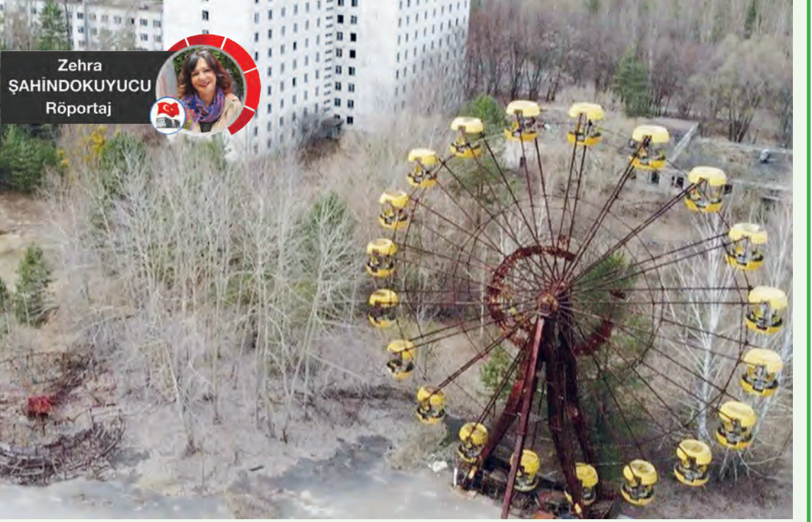
Zehra ŞAHİNDOKUYUCU Röportaj

• Çernobil'in yeterince anlaşılabilmiş dersi nedir?