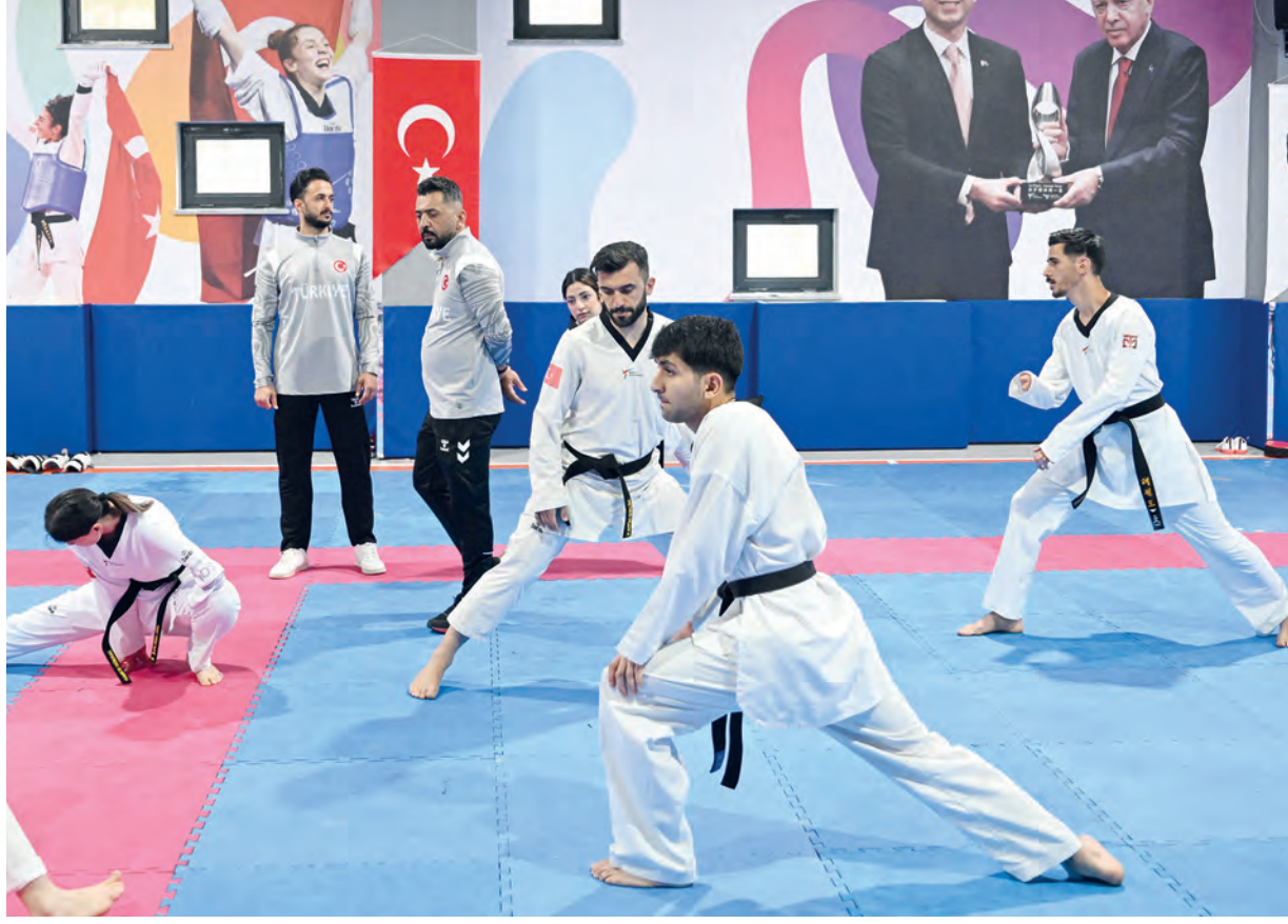
Para Tekvando Milli Takımı'nı Nur Tatar Spor Salonu'nda ziyaret eden Tanrıkulu, burada basın mensuplarına açıklamalarda bulundu.

Milli sporculara başarılar dileyen Tanrıkulu, "2025 yılında takım halinde dünya şampiyonu olduk, sporcularımızla gurur duyuyoruz. O günden bugüne yoğun bir şekilde çalışmalarını devam ediyor. Avrupa şampiyonasında A Milli Takımı'mız ile aynı tarihlerde, aynı zamanda ve yerde Para Milli Takımı'mız da ülkemizi temsil edecek. Sporcularımıza güveniyoruz, onlarla gurur duyuyoruz." ifadelerini kullandı. Paralimpik sporcuların 2024 Paris Olimpiyatları'nın ardından yoğun bir tem-