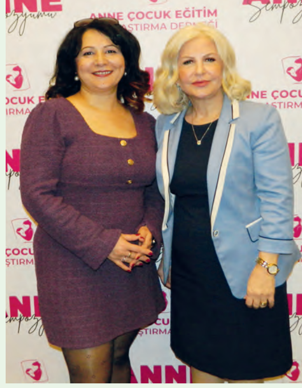
Anne mutlu olursa bebek de çocuk da mutlu olur.

Öncelikle çocukların ruhsal sorunlarının erken dönemde fark edilmesi hayati önem taşıyor. Ruhsal sorunlar çocuklarda yaşa göre farklılık göstermekle birlikte; konuşma gecikmesi, sosyal iletişimde yetersizlik, yoğun öfke nöbetleri, içe kapanma, okul reddi, akademik başarısızlık, kendine zarar verme davranışları, teknoloji bağımlılığı, umutsuzluk ifadeleri ve şiddet eğilimi önemli erken uyarı bulgularıdır. Bununla birlikte ruh sağlığı iyi olmayan bir annenin çocuğundan da ruh sağlığı iyi olamayabilir. Bu çerçevede annelerin ruh sağlığı önemli. Ruh sağlığı bozuk olan bir annenin sorununun çözümlenmesi daha zor olabilir. Anne sağlığı bu nedenle tüm toplumun sağlığını bile etkileyebiliyor.