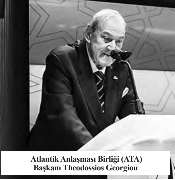
Atlantik Anlaşması Birliği (ATA) Başkanı Theodossios Georgiou

Atlantik Anlaşması Birliği Başkanı Theodossios Georgiou, “Transatlantik ilişkiler zayıflamıyor aksine daha dengeli, daha dayanıklı hale geliyor. Önümüzdeki on yıllarda karşılaşılabilecek stratejik zorluklara karşı daha hazırlıklı hale geliyor. Bu nedenle bu konuda alınacak kararların etkisi, zirvenin çok ötesine uzanacaktır” diye konuştu.