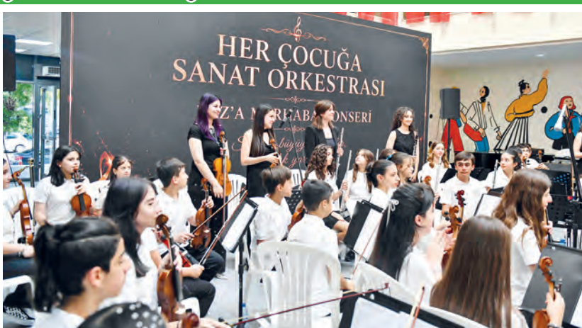
ABB tarafından 29 Ekim 2022'de dezavantajlı bölgelerde yaşayan çocukların sanatsal yeteneklerini keşfetmeleri ve kendilerini müzikle ifade edebilmeleri amacıyla hayata geçirilen "Her Çocuğa Sanat" projesi meyvelerini vermeye devam ediyor. Altındağ Gençlik Merkezi'nin evsahipliği yaptığı proje kapsamında; dezavantajlı bölgelerde yaşayan Başkentli çocuklara alanında uzman akademisyenler tarafından keman, çello, flüt, piyano ve klarnet eğitimi veriliyor. (Haber Merkezi)

Ankara Büyükşehir Belediyesi, fırsat eşitliğini öncelleyen sosyal ve kültürel projelerle çocukların yaşamına dokunmayı sürdürüyor.