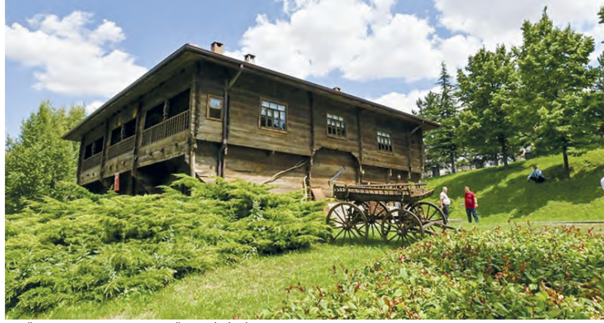
"TÜM ANKARALILARI, MÜZEMİZİ ZİYARET ETMEYE DAVET EDİYORUM"

Şehir hayatının yoğun temposundan uzaklaşmak isteyen ziyaretçiler, Altınköy'de hem doğayla baş başa vakit geçiriyor hem de geleneksel köy yaşamını, üretim kültürünü ve el sanatlarını yerinde deneyimleme imkanı buluyor.