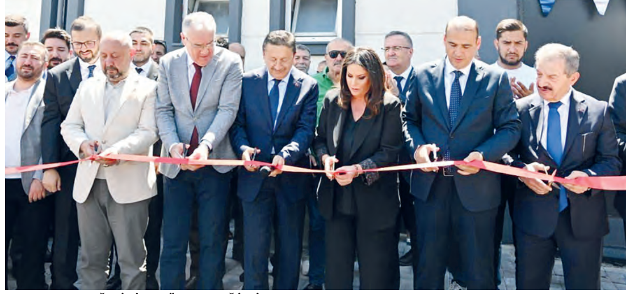
"ALTINDAĞ BİZİM GÖZ BEBEĞİMİZ..."

Tiryaki, şunları kaydetti: "Bugüne kadar kadımlarımız için hayata geçirdiğimiz sosyal belediyeçilik anlayışını, artık erkeklerimiz için de aynı kararlılıkla sürdürüyoruz. Gezi programlarından eğitim faaliyetlerine, kültürel etkinliklerden sosyal buluşmalara kadar birçok hizmeti bu merkezlerimiz aracılığıyla beylerle buluşturacağız. Bununla birlikte Karapürçek mahallemize kazandırdığımız ikinci mahalle konağında taziyelerini yeni sıra, nişan, söz, mezuniyet töreni gibi küçük kutlamaların da yapılacağı bir merkezi daha hizmete açıyoruz. Yatırımlarımızın Karapürçek Mahallemizde ve Altındağımıza hayırlı olmasını temenni ediyorum."