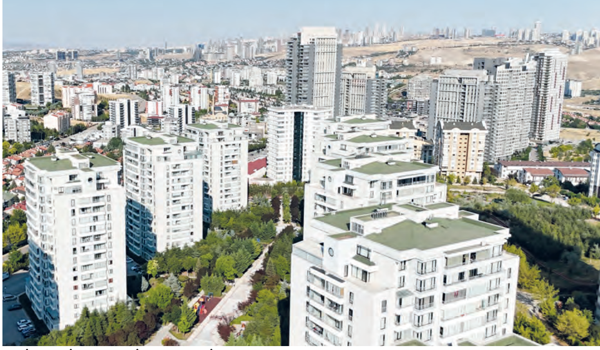
İLAN FİYATLARI İLE SATIŞ FİYATLARI ARASINDAKİ MAKAS AÇILIYOR

Türkiye genelinde son iki yılda yüksek enflasyon, kredi faizlerindeki artış ve finansmana erişimde yaşanan güçlükler konut piyasasının seyrini önemli ölçüde değiştirdi. Özellikle yatırım amaçlı alımların yavaşlamasıyla birlikte piyasada daha çok gerçek ihtiyaç sahiplerinin hareket ettiği bir dönem yaşanıyor. Ankara da bu değişimden en fazla etkilenen büyükşehirler arasında yer alıyor. Başkentte özellikle ikinci el konut piyasasında satış sürelerinin uzaması, satıcıların fiyat beklentilerini aşağı yönlü revize etmelerine neden olurken, alıcılar açısından pazarlık gücü geçmiş yıllara göre belirgin şekilde arttı. Sektör temsilcileri, ilan sitelerinde görülen fiyatların büyük bölümünün artık gerçekleşen satış fiyatlarını yansıtmadığını, birçok bölgede ilan fiyatı ile tapudaki satış bedeli arasında yüzde 10 ila yüzde 20'yi aşan farkların oluşabildiğini belirtiyor. Bu durum piyasada "sessiz konut balonu" tartışmalarını da yeniden gündeme taşıyor. Satış hızındaki yavaşlama, kredi maliyetlerinin yüksek seyretmesi ve ilan fiyatları ile gerçekleşen satış fiyatları arasındaki farkın giderek açılması, hem yatırımcıların hem de ilk kez ev sahibi olmayı planlayanların dikkatini yeniden gayrimenkul sektörüne çevirdi. Uzmanlar, özellikle Temmuz, Ağustos ve Eylül aylarını kapsayan dönemin Ankara'da konut almayı düşünenler açısından önemli fırsatlar barındırdığına işaret ederken, satıcılar için de "gerçekçi fiyatlamalar" döneminin başladığını vurguluyor.